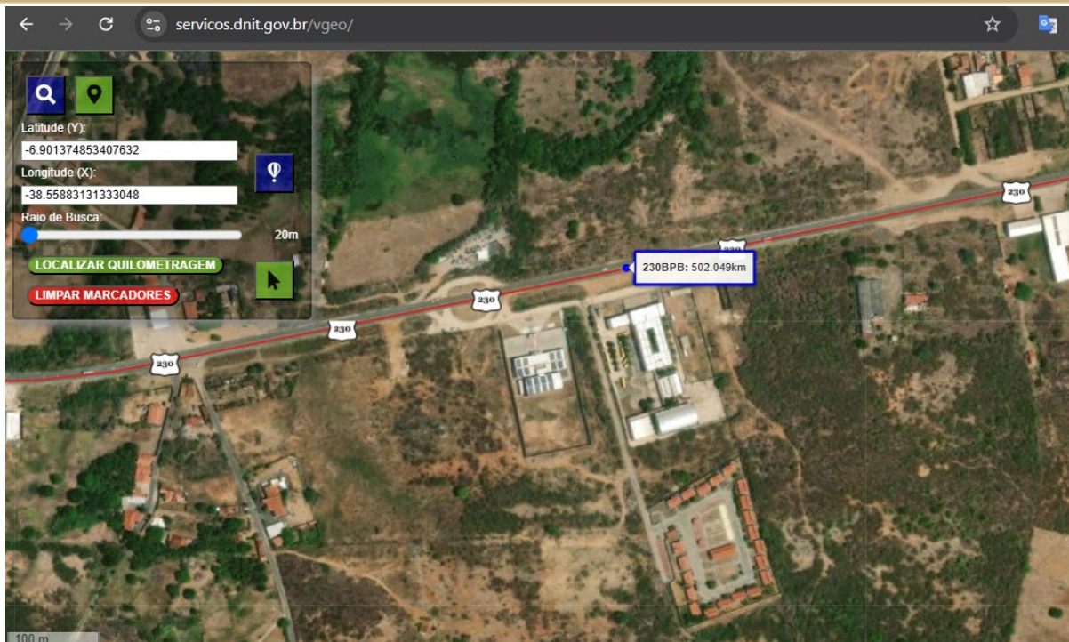
Figura 1 Imagem da via com localização georreferenciada extraída do VGeo.